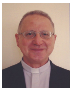
+ Bernard Housset Évêque de la Rochelle et Saintes Président du Conseil National pour la Solidarité

Le partage fraternel avec les plus fragiles et l'engagement social des chrétiens, animés par la charité, sont vitaux pour le développement de tous les humains – proches et lointains. C'est tout l'enjeu de Diaconia 2013 !