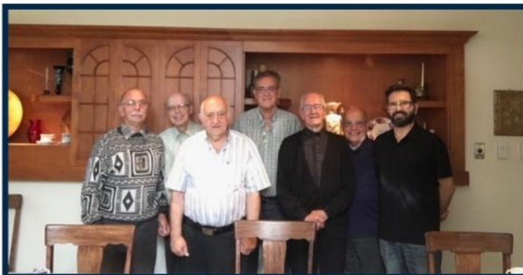
Réunion des Eudistes du Nouveau Brunswick

Habitué à l'animation, il est missionné de 1997 à 1999 en tant que Responsable de l'équipe des prêtres en charge de cette fonction, pour être ensuite aumônier à l'Accueil Notre Dame, puis celui de l'Hospitalité Notre Dame de Lourdes de 2012 à 2015.